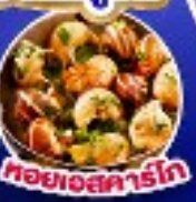
ทอยยอสการ์โก

เดินทาง 17-25 ก.ย.67/11-19,18-26 ต.ค.67 14-22 พ.ย.67/30 พ.ย.-8 ธ.ค.67 25 ธ.ค.67 - 2 ม.ค.68(เทศกาลปีใหม่)