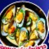
หอยนางรมฝรั่งเศส