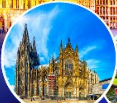
มหาวิหารแห่งโคโลญ หมู่บ้านกีร์ชุน