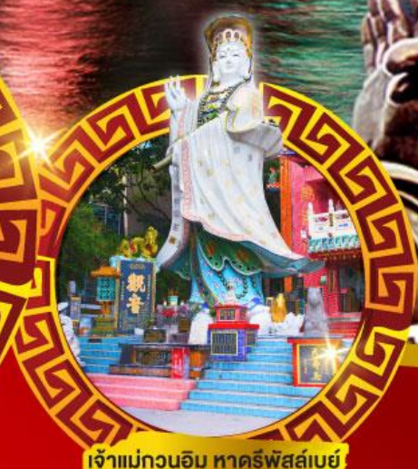
เจ้าแม่กวนอิม หาดริฟส์เบย์