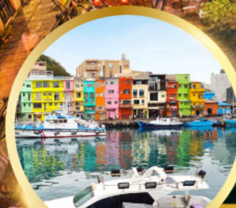
หมู่บ้านชาวประมง