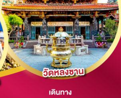
วัดหลงซาน