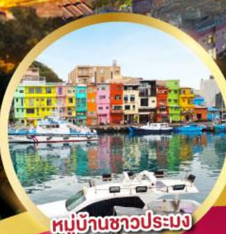
หมู่บ้านชาวประมง