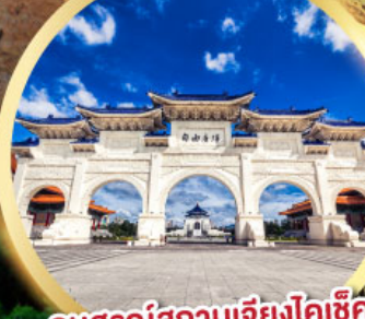
อนุสรณ์สถานเจียงไคเช็ค