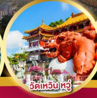
วัดเหวินหู