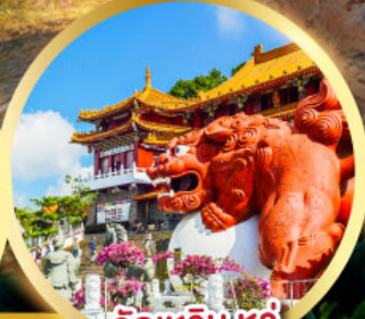
วัดเหวินหวู่