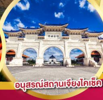
อนุสรณ์สถานเจียงไคเช็ค