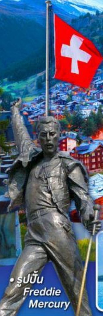
• รูปปั้น Freddie Mercury

พีชิต 5 เจริญ, เชาฮาร์เคอร์คุม, เชาจุงเฟรา เชาคลาเชียร์ 3000 และ เชากรอนเนอร์แกรต