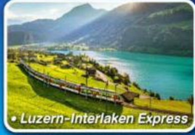
• Luzern-Interlaken Express