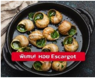
พิเศษ! หอย Escargot