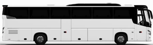
ตัวอย่างรูปภาพรถ 1 ชั้น

หากประเภทห้องที่ท่านริเวสมาเต็ม อาทิ เช่น ริเวสห้องพักเป็น TWIN BED หรือ DOUBLE BED ทางบริษัทขอสงวนสิทธิ์ในการปรับประเภทห้องพักเป็นตามที่มีโรงแรมมีอยู่ โดยไม่ต้องแจ้งให้ทราบล่วงหน้า