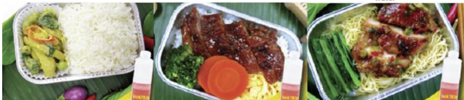
Chicken roasted with herb and noodle and water