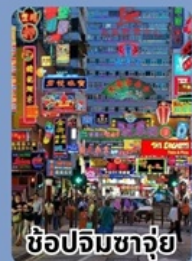
ช้อปปิ้งจิวจ๋วย