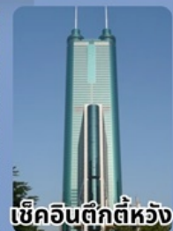
เซ็คฉินตึกตีห้วง