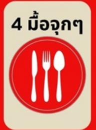
4 มื้ออู่กๆ