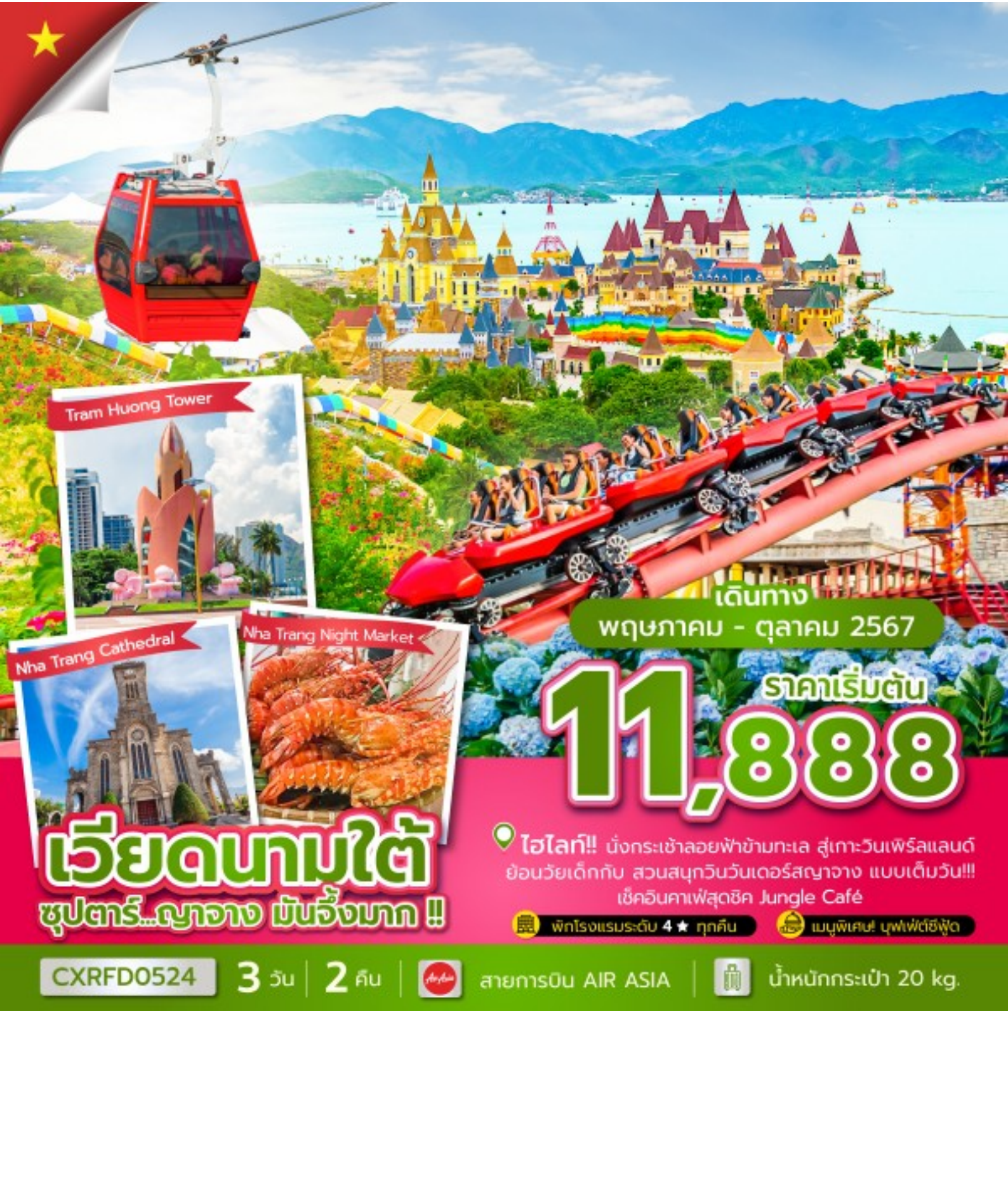
Tram Huong Tower