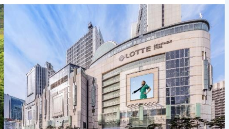
Lotte Center Hanoi

*ทางบริษัทฯ ขอสงวนสิทธิ์ในการสลับโปรแกรมทัวร์ตามความเหมาะสมขึ้นอยู่กับสถานการณ์หน้างาน โดยคำนึงถึงผลประโยชน์ของลูกค้าเป็นสำคัญ