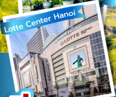
Lotte Center Hanoi