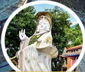
เจ้าแม่กวนอิม รัฟลีส เบย์