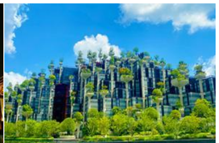
ตึกเทียนอัน (อาคารไม้พันต้น )

วันที่สอง นครเชียงใหม่ – เมืองโบราณซิเป่า – ตลาดฉางหวงเมี่ยว – ตึกเทียนอัน – ย่านเถียนจื่อฝาง