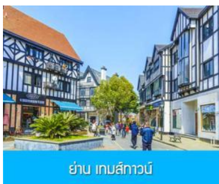
ย่าน เกมส์ทาวน์

พักที่ โรงแรม Luna Garden Hotel or Holiday Inn Express Hotel 4* หรือเทียบเท่าในเมืองเซี่ยงไฮ้