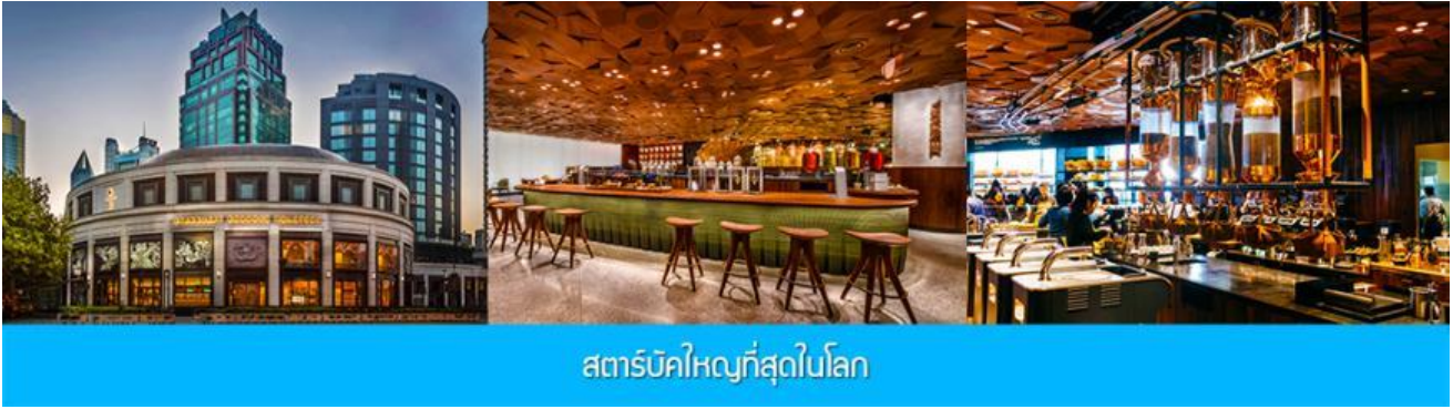
สตาร์บัคใหญ่ที่สุดในโลก

วันแรก กรุงเทพฯ (ท่าอากาศยานดอนเมือง) – นครเชียงใหม่ – สตาร์บัคใหญ่ที่สุดในโลก