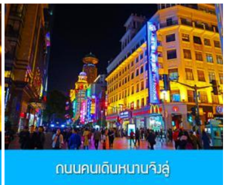
ถนนคนเดินหนานจิงลุ่