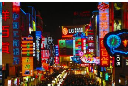
ถนนคนเดินชุนซีลู่