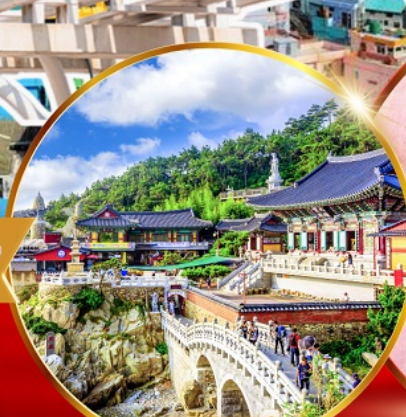
วัดแสงยงกุงซา