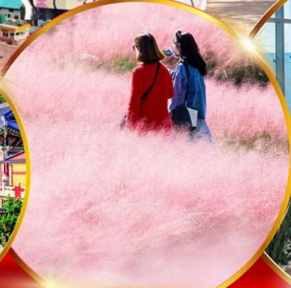
สวนสาธารณะแดโจ