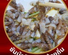
ซันนั๊กจิ อาหารท้องถิ่น