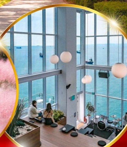
คาเฟ่วิวทะเล

ถ้ายุโรปชิลๆ หมู่บ้านวัฒนธรรมคิมชอน ใหม่ล่าสุด คาเฟ่ริมทะเล อี้อลลิกลับ ชมอุโมงค์ต้นเมเปิ้ล สีส้มแดง ถ้ายุโรปกับหญิงสาวสวย สดใส ขึ้นเคเบิลคาร์ ชมทะเลปูซาน ห้ามพลาด!! ตลาดปลาที่ใหญ่ที่สุด ชิมของอร่อยที่ตลาดแฮอุนแด อิสระช้อปปิ้ง Lotte Duty Free