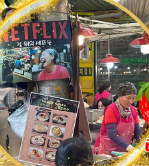
ตลาดกวางจ้ง