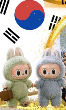
ห้องสมุด Starfield