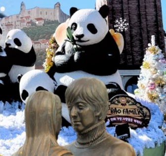
มีผลตอบเอบอจึสุด ๆ จากรั้