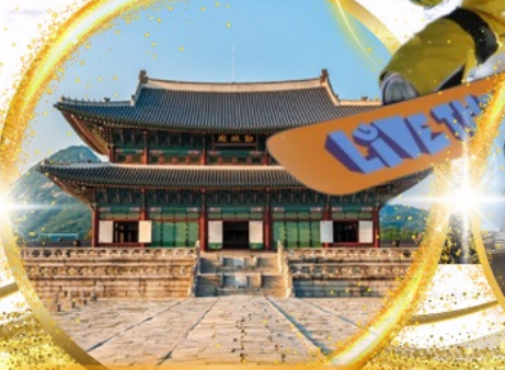
พระราชวังเคียงบกกรุง