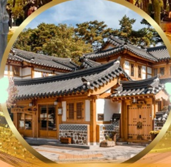
หมู่บ้านโบราณอินช็อง