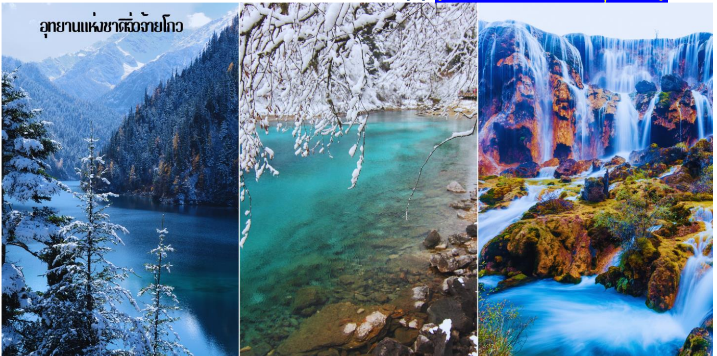
อุทยานแห่งชาติจิวจ้ายโกว

กลางวัน ๑๐ บริการอาหารกลางวัน ณ ภัตตาคาร(6) (ห้องอาหารภายในอุทยาน)