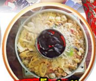
เมนูพิเศษ!! สุกี้เห็ดโตดำ+ปลาเซลมอน