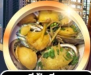
เมมูซี่ฟู้ดลี่ยูนนาน