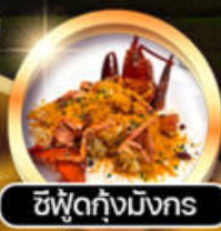
ซิวัดกึ่งมังกร