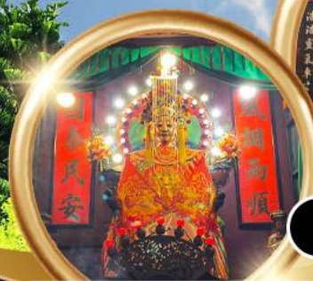
ขอพรซื้อขายอสังหาริมทรัพย์