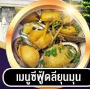
เมนูซีฟู้ดลิ้นมดุน