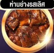
ห่านย่างสลีส