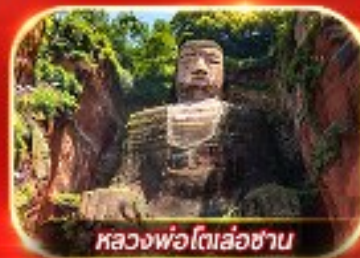
หลวงพ่โตเล่อซาน