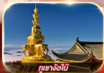
ภูเขาจ้อไบ้