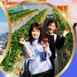
บุฟเฟต์ สตอเบอร์รี่ เก็บสดจากต้น