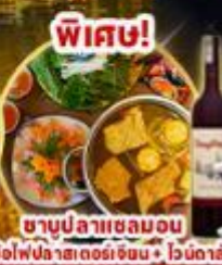
เมนูถ้วยเต๋อซว๋ ซ้ำมสะพาน