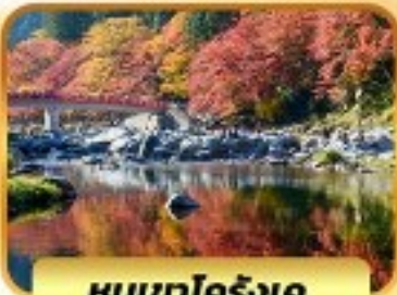
หุบเขาโคริงเค