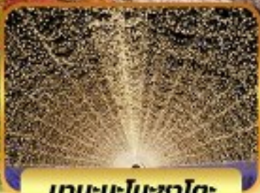
นาบะนะโนะซาโตะ