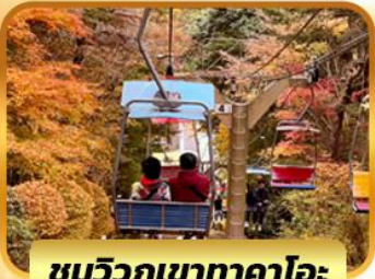
ชมวิวกุเขาทาคาโอะ