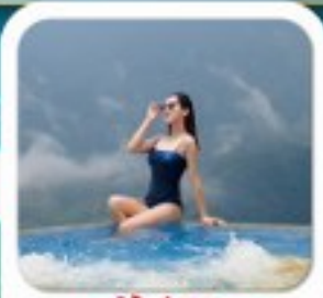
"พัก 4 คืน PISTACHIO HOTEL"