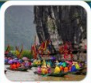
"ล่องเรือจางอาน"