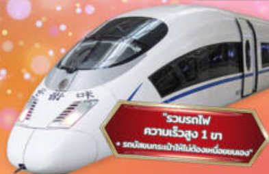
"รวมรถไฟ ความเร็วสูง 1 ไร่ + รถบริการเข้าที่พักเมืองหนิงเหมิง"