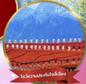
โชว์ความประทับใจลี่เจียง