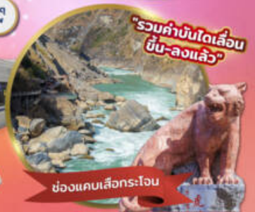
"รวมค่าบินได้เลื่อน ขึ้น-ลงแล้ว"