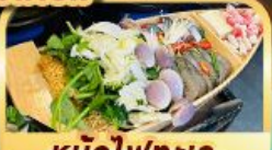
หม้อไฟทะเล