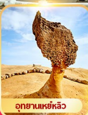
อุทยานเหย์หลิว