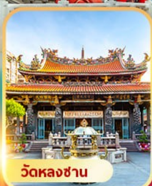
วัดหลงซาน