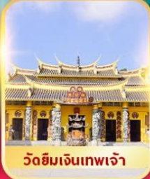
วัดยิมเงินเทพเจ้า