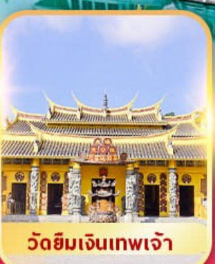
วัดยิมเงินเทพเจ้า