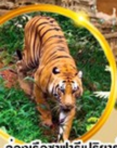
ล่องเรือซาฟารีเปรียงาร์