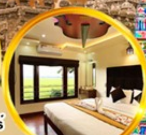
พักบ้านเรือสิมผัสธรรมชาติ