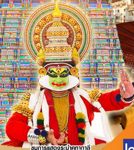
ชมการแสดงระบำคทากาลี