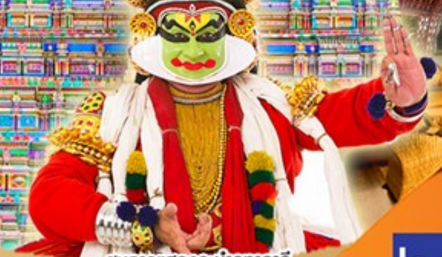
ชมการแสดงระบำคากาลี