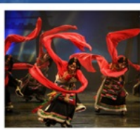
โชว์ทิเบต