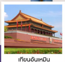
เทียนอันเหมิน