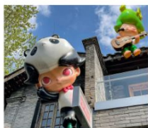
ถนนคนเดินชอยกว้างแอก