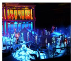
โรงละคร ONLY HENAN