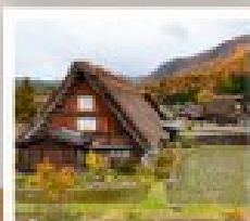
ริซากาวาโกะ