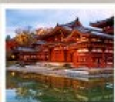
วัดเมียวโงอิน