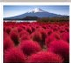
สวนโองชิชิ ภารัง

วัดเมียวโงอิน / ถนนเมียวโงอิน โฮโมเตะชินโด / ฟูชิชิ ฮันริ ริซากาวาโกะ / อินมาชิ ซุจิ / ทามิกิจิ / สะพานกินปะ / สวนโองชิชิ ภารัง ตุโมงทาบเนเม็ค / โอชิโนะ ฮัทสึ / สวนโองชิชิเนน / วัดอาซากุสะ ตลาดปลาซึกิจิ / ฮิมเม็งฮิมซุกุ / มิดซุชิ เอากิเค็ง พาร์ค คิซารุชิ