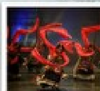
โรว์ทิเบต