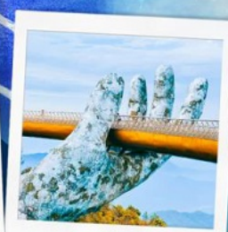
บาน่าฮิลล์