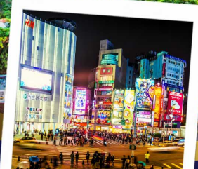
ช้อปปิ้งซีเหมินติง