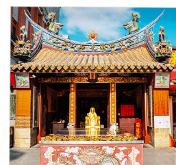
วัดเสี่ยวไท่เจิงหวง