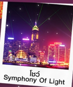
โชว์ Symphony Of Light