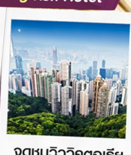
จุดชมวิวกตอเรีย