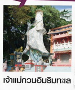
เจ้าแม่กวนอิมริมทะเล