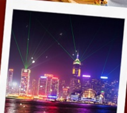
ชมโชว์ SYMPHONY OF LIGHT