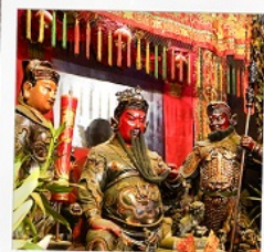
เทพเจ้ากวนอู วัดถวณไถ