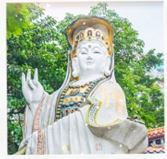
เจ้าแม่กวนอิมธิพลัสสมัย