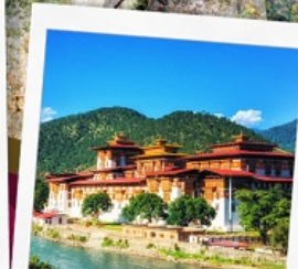
พูนาคาซอง