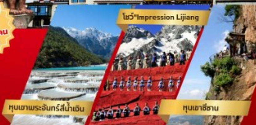
โชว์ Impression Lijiang