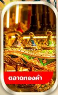
ตลาดทองคำ