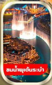
ชมน้ำพุต้นระบำ

นั่งรถ 4WD ชมทะเลทรายอาหาร พร้อมทานดินเนอร์อาราเบีย