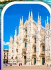
DUOMO MILAN ITALY