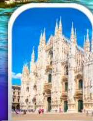
DUOMO MILAN ITALY