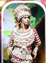
หมู่บ้านชนเผ่า