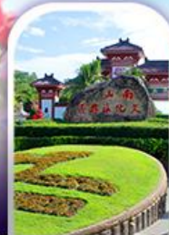
อุทยานหนานชาน

ทางเดินริมชายทะเลซานย่า • ทุ่งดอกกุหลาบอ่าวย่าหลง อุทยานหนานชาน • เทียบบนเกาะดอกไม้ • ทุ่งเกลือพันปี ช้อปปิ้งไนท์มาร์เก็ตถนนโบราณฉีหลอ