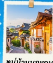
หมู่บ้านนูกซอน