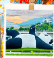
แพนด้าเซลล์