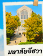
มหาชัยชีวา