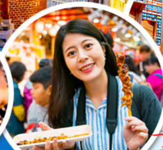
ตลาดควางจง