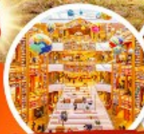
ห้องสมุดสตาร์ฟิสต์

• พิเศษ!! ใส่ชุดฮันบกเดินวัง + ถนนสายโรแมนติคที่อกซุกง