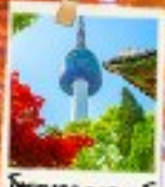
โซลทาวเวอร์