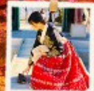
ใส่ชุดฮันบก