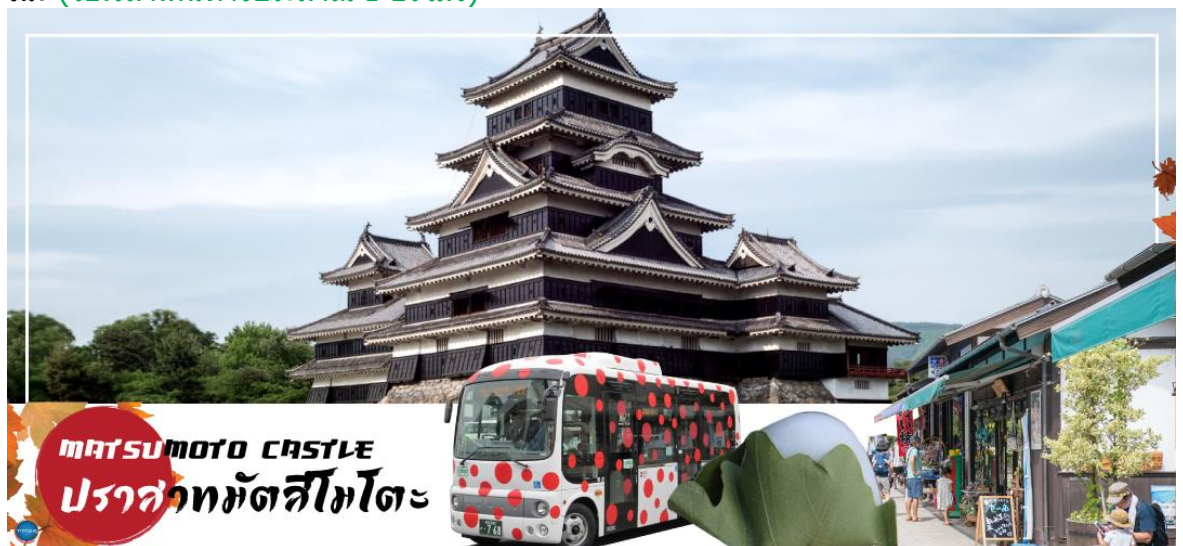
MATSUMOTO CASTLE ปราสาทมัตสึโมโตะ

จากนั้นนำท่านเดินทางสู่ คามิโคจิ (Kamikochi) (ใช้เวลาเดินทางประมาณ 50 นาที) แหล่งท่องเที่ยวทางธรรมชาติที่มีทิวทัศน์ภูเขาที่สวยงามที่สุดแห่งหนึ่งของประเทศญี่ปุ่น ดินแดนแห่งธรรมชาติท่ามกลางหุบเขาแสนสวยของเทือกเขา "เจแปน แอลป์" (Japan Alps) เป็นหุบเขาในพื้นที่อยู่สูงขึ้นไปทางเหนือของเทือกเขาแอลป์ญี่ปุ่น ภาพสายน้ำของแม่น้ำอะซุสะ ที่ใสสะอาดไหลผ่านสะพานคัปปะ ล้อมรอบด้วยต้นป่าเขียวขจี และฉากหลังของยอดเขาสูงตระหง่านระดับ 3,000 เมตรให้ท่านได้เพลิดเพลินกับการเดินเล่นสบายๆ ไปกับธรรมชาติที่สวยงาม อิสระให้ท่านได้เก็บภาพความประทับใจตามอัธยาศัย สะพานคัปปะ-บะชิ เป็นจุดที่มีคนเยอะที่สุดในคามิโคจิ และในบางครั้งก็ให้ความรู้สึกเหมือนทางแยกที่มีชื่อเสียงของชินญะ มีผู้คนมากมายเดินข้ามไปข้ามมาอยู่ไม่หยุดหย่อน มาถ่ายรูปใกล้กับสะพานหรือบนสะพาน นำท่านเดินทางสู่ เมืองมัตสึโมโตะ (Matsumoto) เป็นเมืองที่ใหญ่เป็นอันดับสองของจังหวัดนากาโนะ (ใช้เวลาเดินทางประมาณ 1 ชั่วโมง)