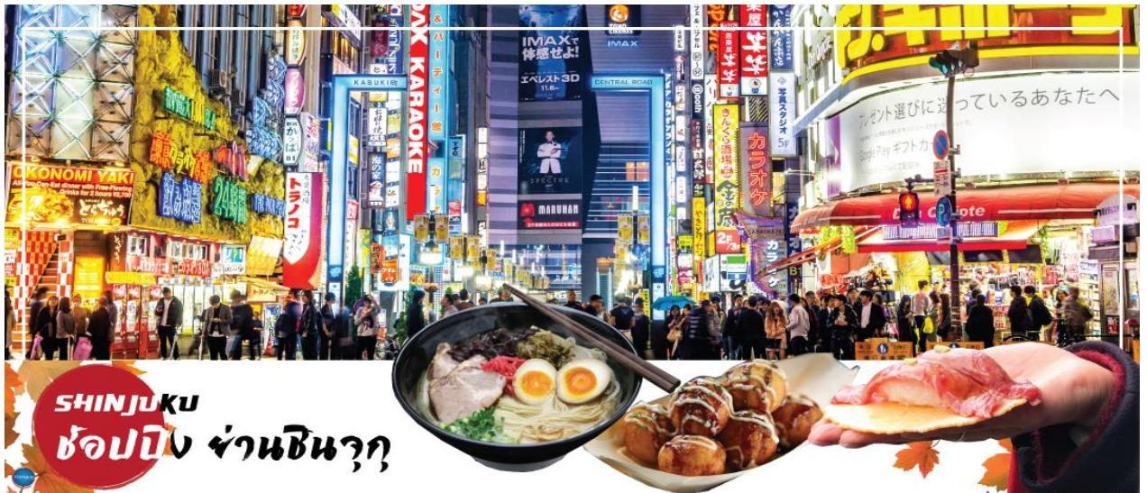
SHINJUKU ช้อปปิ้ง ย่านชินจูกุ

ได้เวลาอันสมควรนำท่านเดินทางสู่ เมืองนาริตะ (ใช้เวลาเดินทางประมาณ 1 ชั่วโมง)